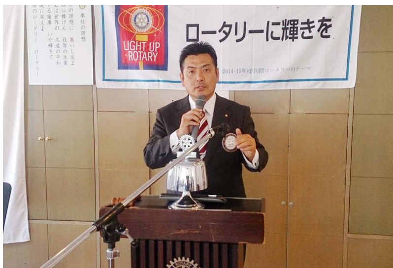
大原会長 あいさつ